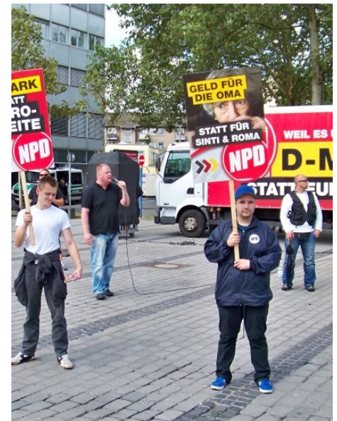
NPD-Kundgebung Duisburg-Stadtmitte, 17.08.2013 (Bildschirmfoto DS 18.08.2013)

Die Zeitungsmeldung von den angeblichen 3000 Tatverdächtigen suggerierte, nahezu alle Migrant_innen aus Südosteuropa seien kriminell. Das Bedrohungs-