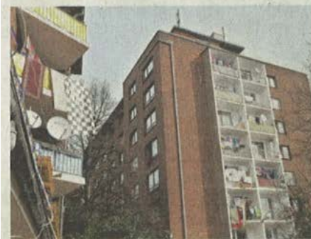
Im Haus In den Peschen sollen aktuell um die 300 Menschen leben.

Bergheim. Die Diskussion um die Roma-Familien aus dem Haus In den Peschen, die offenbar auf Druck des Vermieters von der Stadt aus dem Melderegister gestrichen wurden, hält an. Sowohl Eduard Pusic vom Integrationsverein „Zof“ als auch der Rheinhauser Pfarrer Dieter Herberth bestätigen die Aussagen, dass sämtliche Bewohner des sogenannten „Problemhauses“ abgemeldet worden waren. Dieser Vorgang sei, da die Menschen nicht umgezogen waren, nicht statthaft. Inzwischen kursierten rund um das Haus sogenannte „Anträge auf berichtigen des Melderegister“, damit können sich die Bewohner wieder beim Bezirksamt anmelden. dc