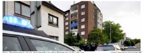
Das „Problemhaus“ an der Straße in den Peschen in Duisburg