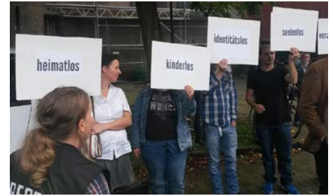
Plakataktion von Aktivist_innen der extremen Rechten auf der Bürgerversammlung in Neumühl am 19.09.2014.