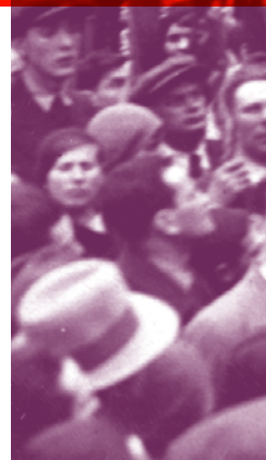
Henryk Erlich bei einer Demonstration am 1. Mai 1933 in Warschau