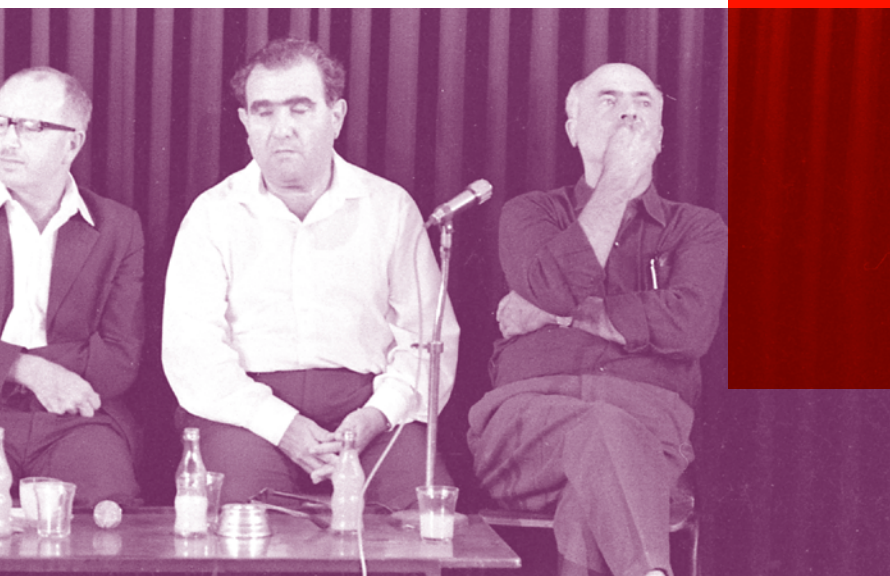
Eine Talkrunde mit Shulamit Aloni (l.) im Tel Aviver Theater Tzavta im Jahr 1969

sich wiederholt an Koalitionsregierungen. 1973 konstituierte sich die neben der Mafpam ebenfalls im linken Parteienspektrum zu verortende Tnuah le-S'chujot ha-Esrach u-le-Schalom (Bewegung für Bürgerrechte und Frieden, Raz), geführt durch die ehemalige Knesset-Abgeordnete der Arbeitspartei Shulamit Aloni. Sie forderte die Demokratisierung der israelischen Gesellschaft, trat für die Gleichberechtigung aller Bürgerinnen und Bürger des Landes ein und sprach sich gegen religiösen Zwang aus. 1992 beteiligte sich ein aus Raz, Mafpam und der Zentrumsparterie Schinui (Veränderung) bestehendes linkes Wahlbündnis an der Regierung Rabin. 1997 erfolgte der offizielle Zusammenschluss zur Partei Merez. Diese war 1999 bis 2001 nochmals in einer unter Führung der Arbeitspartei stehenden Regierungskoalition vertreten.