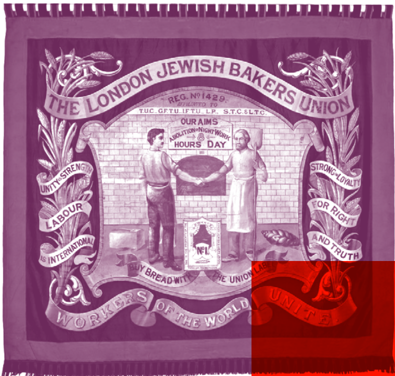
Banner der London Jewish Bakers' Union

In dem Maße, in dem eine antikoloniale und antiimperialistische Deutung des Nahostkonflikts nach 1967 und neue linke Strömungen dominanter wurden und die Erinnerung an die Shoah verblasste, änderte sich die Sichtweise der Linken innerhalb