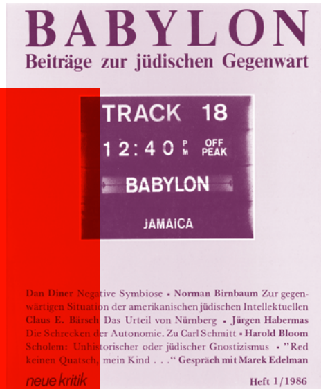
Cover der ersten Ausgabe der Babylon aus dem Jahr 1986