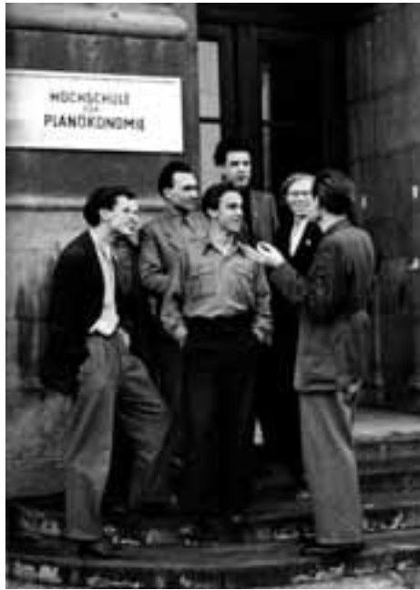
Die ersten Studenten

besondere sein sozialer Bezug. Die Absolventinnen und Absolventen sollten sich auch durch soziale Kompetenz auszeichnen. Das Studium sollte als wissenschaftlicher Prozess nicht nur Wissen und Details vermitteln, sondern vor allem die Studierenden zum selbstständigen Arbeiten und Denken befähigen und sie in die Lage versetzen, die inhaltlichen Zusammenhänge, Erfordernisse und Gesetzmäßigkeiten des betrieblichen und volkswirtschaftlichen Wirtschaftskreislaufes zu verstehen und auf dieser Grundlage sachgerechte Entscheidungen zu treffen. Auch die Praktika während des Studiums dienten diesem Ziel. Der relativ enge und verbindliche Rahmen des Studienplanes, vor allem hinsichtlich der Anzahl der Wochenstunden, setzte